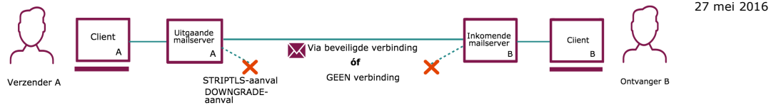
Figuur 4. E-mailverkeer met gebruik van TLS, STARTTLS en DANE