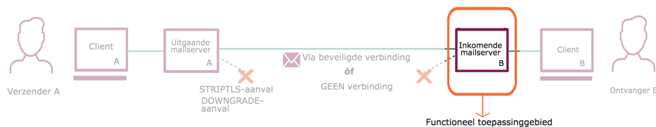
Figuur 1. Geadviseerd functioneel toepassingsgebied

Inkomende mailservers passen STARTTLS (SMTP over STARTTLS, oftewel ESMTPS) in combinatie met DANE toe, zodat verzendende mailservers daarmee een versleutelde verbinding over een onvertrouwd netwerk (zoals internet) kunnen opzetten. Dit voorkomt dat aanvallers het mailverkeer kunnen afluisteren (passieve aanvallers) en/of kunnen manipuleren (actieve aanvallers). 1